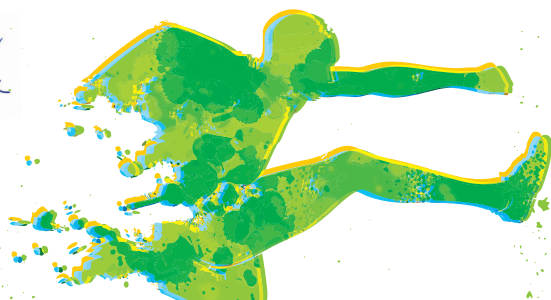
Markus Ochsenkühn Oberbürgermeister